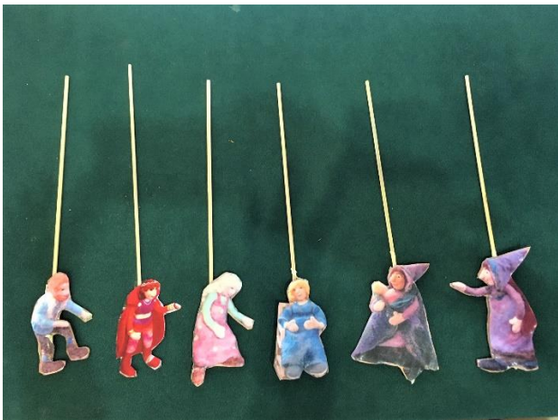
Stabpuppen zum Märchen Rapunzel **